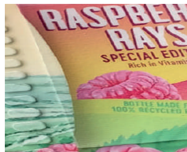
Qualité d'impression HD