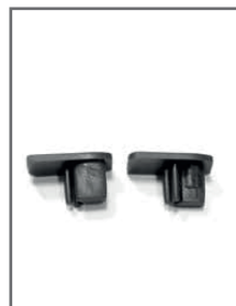
Clip - rail

Les gabarits d'impression mis à disposition sont fournis à titre indicatif. Ils tiennent compte de procédés internes qui peuvent varier selon vos équipements, matières & finitions. En cas d'impression par vos soins, il vous appartient de tester au préalable la compatibilité de votre media avec le produit avant utilisation.